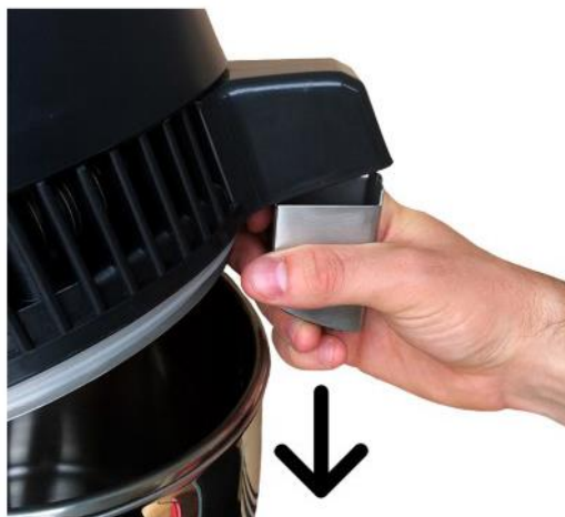
3. ábra: szűrőcsere.

Javasoljuk, hogy minden egyes desztillálás után, vegye ki a széniszűrőt (lásd a lenti ábra), törölgesse át papír törülkövel, tegye meleg helyre 1-2 órára, hogy a széniszűrő megszáradjon. Ha megszáradt, helyezze vissza a széniszűrőt a helyére.